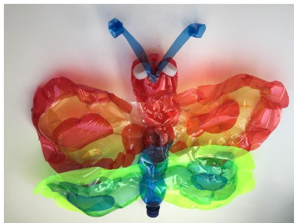
Jarní zvěřinec (brouci) – brouci z pet lahví