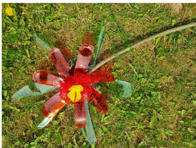
Maxikvět – květina z pet lahví