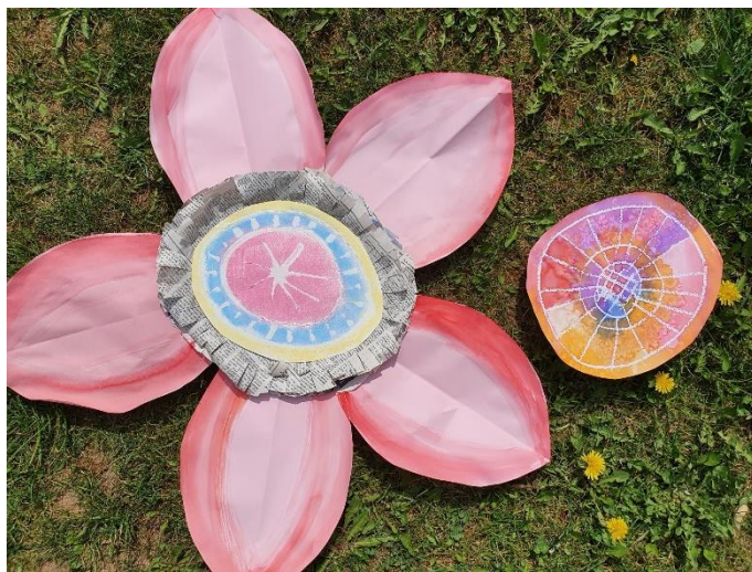
Maxikvět – kombinovaná technika (střed – kresba lepidlem, po zaschnutí křída)

Pokud bys chtěl nějakou nabízenou techniku použít a není ti jasný postup, připoj se ve středu na konferenci, vše vysvětlíme.