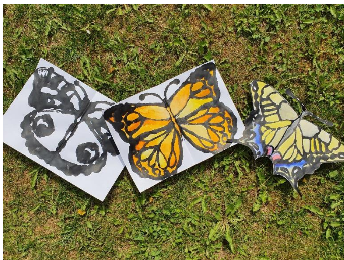
Jarní zvěřinec (motýl) - symetrický otisk (kontura – kresba obarveným lepidlem na jednu polovinu papíru, symetrický otisk na druhou stranu, po zaschnutí dobarvení anilinovými barvami)