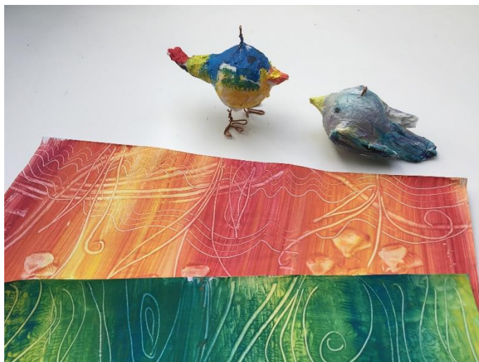
Jarní zvěřinec – škrabová technika (rytá kresba do obarvené škrabové hmoty, modelování ptáčka z ubrousků na pingpongovém míčku namáčených ve škrabové hmotě)