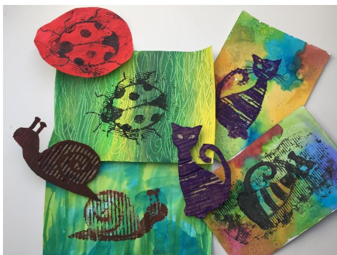
Jarní zvěřinec – tisk z lepenky (matrice vyřezaná z lepenky, struktura vytvořena prořezem a odstraněním vrchní vrstvy lepenky)