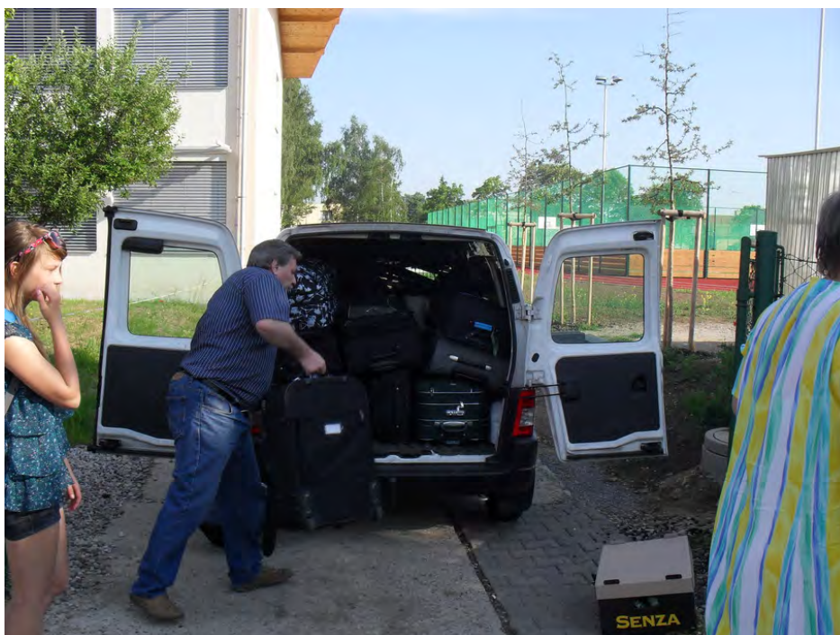
Obrázek 1 – Nakládání zavazadel u školy

Po večeri následoval naučně-zábavný program zahrnující shrnutí denních zážitků, diskuzi o roli vozíčkářů ve společnosti, výklad o pravidlech bezpečnosti při pobytu na horách, zásahu elektrickým proudem a chování při bouři. Završením programu byly skupinové hry a dobrovolný půlhodinový trénink v místní tělocvičně.