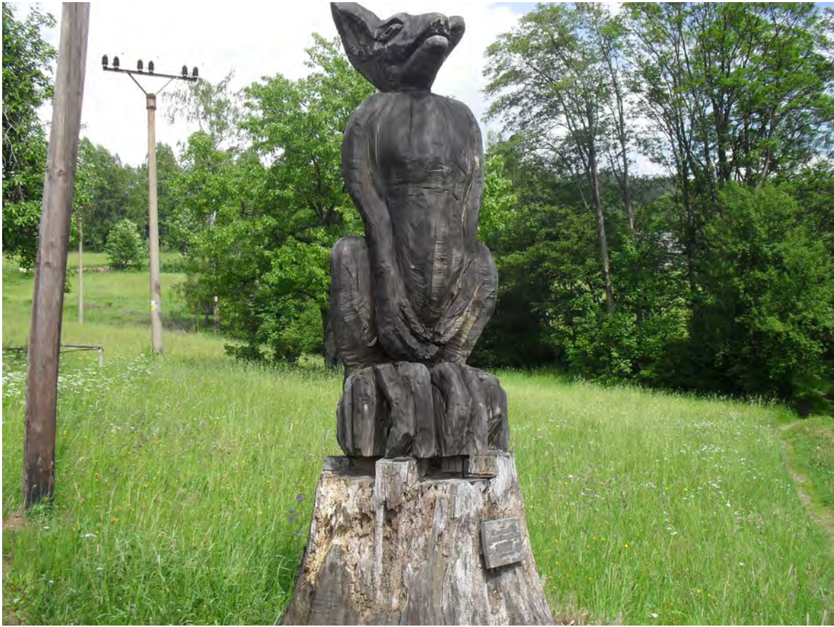
Obrázek 4 – Dřevěná skulptura