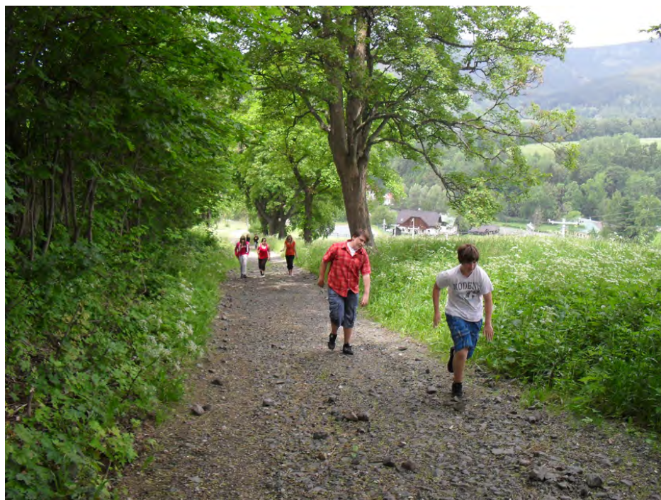
Obrázek 2 – Výstup z autobusového nádraží v Rokytnici na chatu

dobry. Slunicko nam krásně svítlo do zad a my jsme si mysleli, že se konečně opálíme, ale to se během pěti minut změnilo a z naprostého jasná najednou začala bouřka. Byl to opravdový krkonošský slejvák. Na chatě jsme se všichni usušili a převlékli se do suchého oblečení. Po večeri jsme se všichni rozlezli do svých pokojů a nechali si zdát o zítřejší Bozkovských jeskyních 4